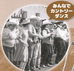
みんなで カントリー ダンス