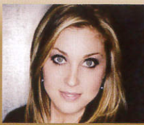
Sunny Sweeney (サニー スウィニー)