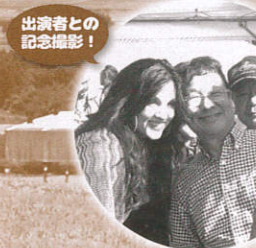
出演者との 記念撮影!