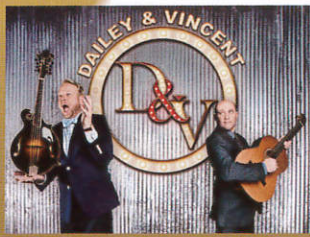
DAILEY & VINCENT (テイラー&ヴィンセント)